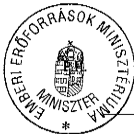
Balog Zoltán emberi erőforrások minisztere