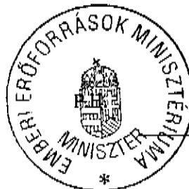
Balog Zoltán emberi erőforrások minisztere